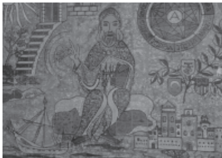
Mural fet per Fra Salvador Cabot, TOR

A nivell de Secundària i Batxillerat el Departament de Pastoral ha fet suggeriments al professorat per poder treballar algun aspecte de la vida i obra de Ramon Llull des de les diferents assignatures, d'aquesta manera el nostre Beat serà eix transversal en totes les matèries del dilluns 27 de novembre.