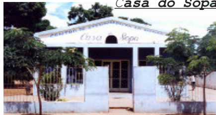
Casa do Sopa

Les xerrades, que aniran adreçades a alumnes d'ESO i Batxillerat els dies 25 i 26 i per als pares el dijous 25 a les 20 h, a la Sala d'Actes P. Sebastià Rosselló, es faran en distints torns que coordina el Departament de Pastoral.